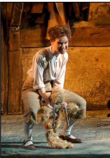
Hänsel und Gretel - Hänsel